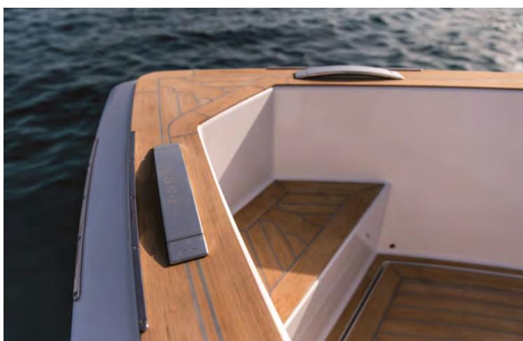
Table électrique multiposition (hauteur/longueur):

Taquets rabattables et marche d'accès intégrée: